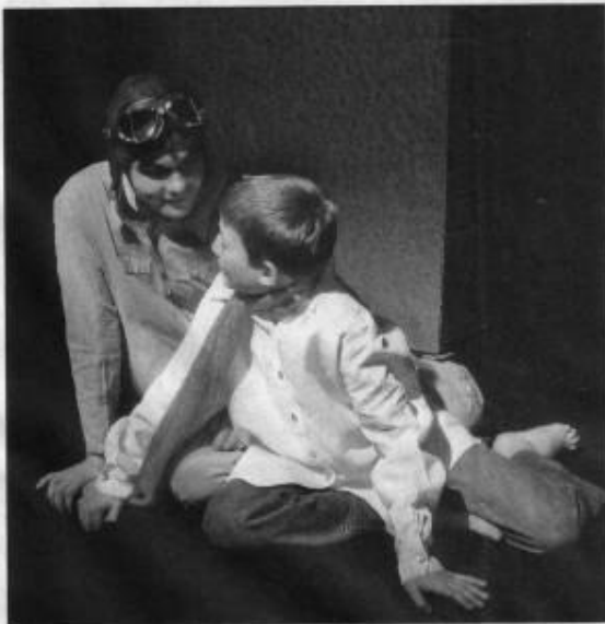
Le Nouveau Théâtre présentera Le Petit Prince le 7 mai à la salle CO2