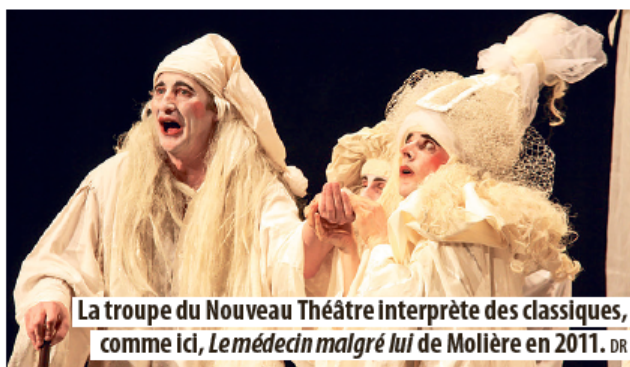
La troupe du Nouveau Théâtre interprète des classiques, comme ici, Le médecin malgré lui de Molière en 2011.